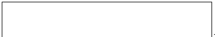
Схема границы эксплуатационной ответственности

(указать адрес, наименование объектов и оборудования, по которым определяется граница балансовой принадлежности организации водопроводно-канализационного хозяйства и заказчика)